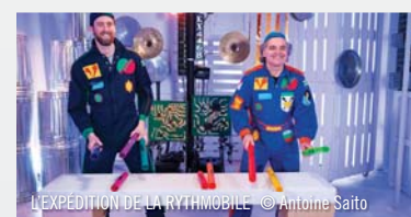
L'EXPÉDITION DE LA RYTHMOBILE