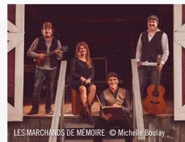
LES MARCHANDS DE MÉMOIRE

Le collectif Les Marchands de mémoire convie le public à une soirée de contes et de chansons autour d'un feu. Ce spectacle est une invitation à raviver les souvenirs d'antan au son des refrains des coureurs des bois et une occasion de se replonger dans la mémoire collective.