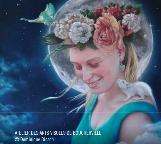
ATELIER DES ARTS VISUELS DE BOUCHERVILLE