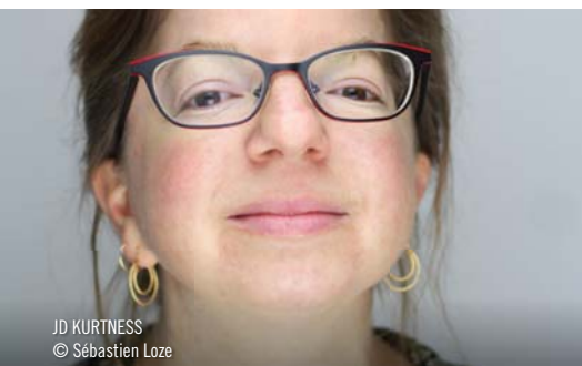
JD KURTNESS

Originnaire de Chicoutimi et imprégnée de ses racines québécoises et innues, l'autrice vous emporte dans un voyage littéraire saisissant, mêlant humour noir et profonde réflexion.