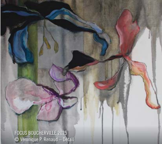
FOCUS BOUCHERVILLE 2025 © Véronique P. Renaud – Détail