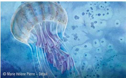
© Marie Hélène Pierre – Détail