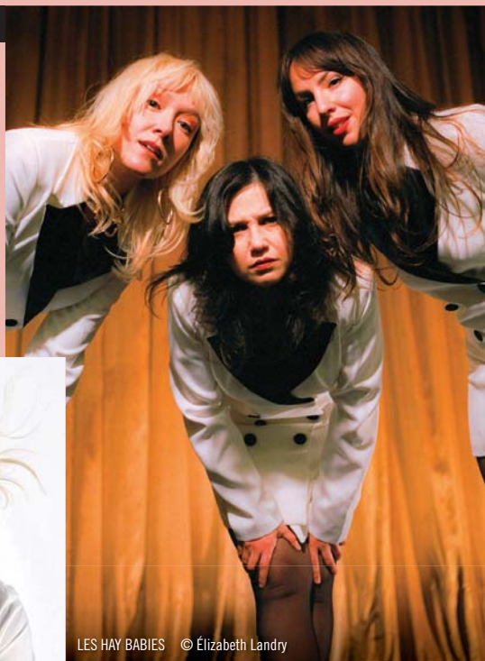
LES HAY BABIES